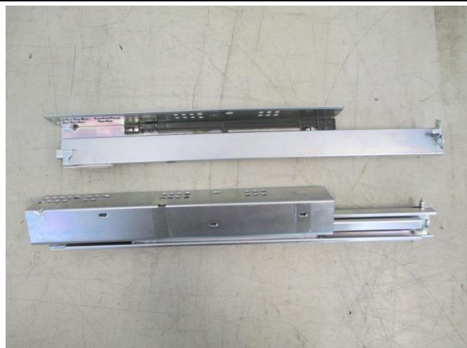
Pic. 1: Overview (unextended)